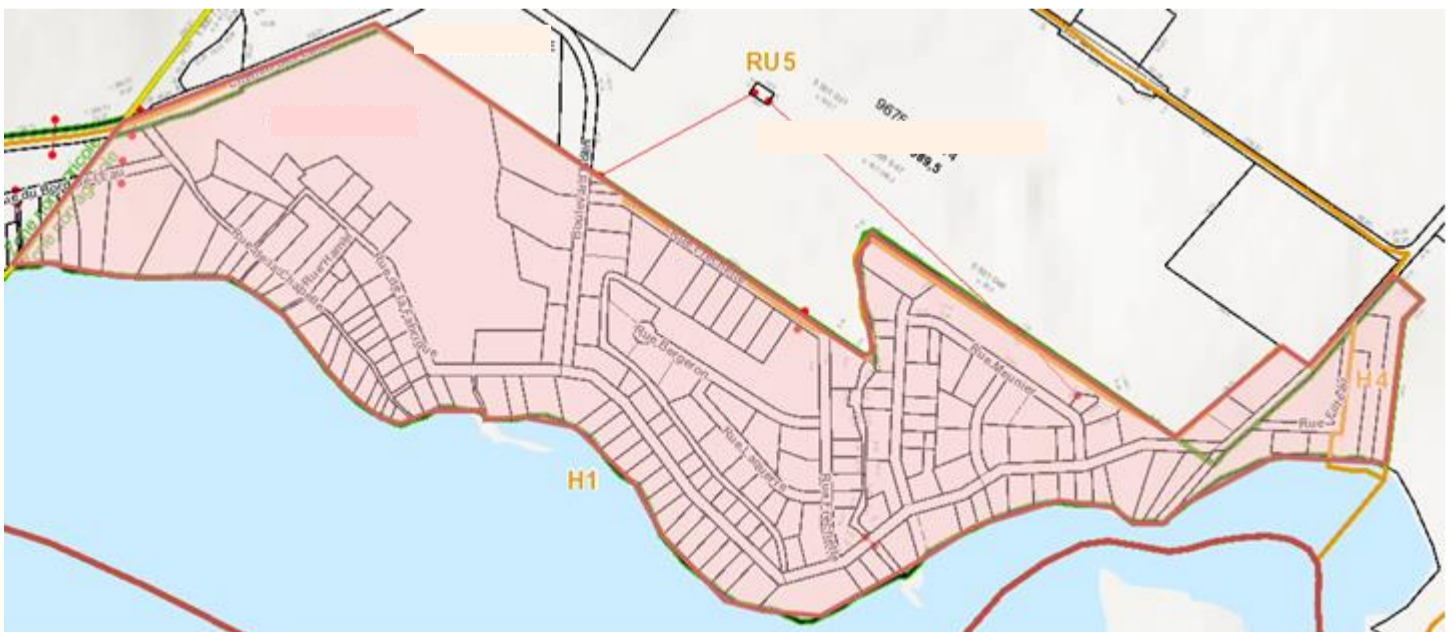
Illustration des zones visées